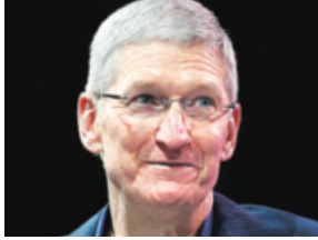
टिम कुक, सीईओ, ऐपल

ऐपल के मुख्य कार्याधिकारी टिम कुक ने विश्लेषकों से कहा, ‘यह हमारे लिए काफी अच्छी तिमाही रही। भारत एक बेमिसाल और शानदार बाजार है जहां हम प्रमुखता से ध्यान केंद्रित कर रहे हैं। मैं हाल में वहां गया था। भारत में बाजार की रफ्तार और जीवंतता अद्भुत है।’ कुक ने कहा, ‘धीरे-धीरे हम अपने भारतीय कारोबार का विस्तार कर रहे हैं ताकि अधिक से अधिक ग्राहकों को सेवाएं उपलब्ध कराई जा सकें। करीब तीन साल पहले हमने ऐपल स्टोर को ऑनलाइन शुरू किया था। कुछ ही सप्ताह पहले हमने मुंबई और दिल्ली में दो ऑफलाइन स्टोर शुरू किए हैं। इन दोनों स्टोरों की शुरुआत काफी अच्छी रही है।’ ऐपल