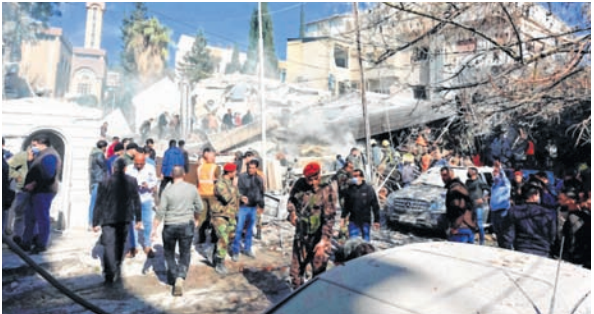
People and security forces gather in front of a building destroyed in a reported Israeli strike in Damascus on Saturday