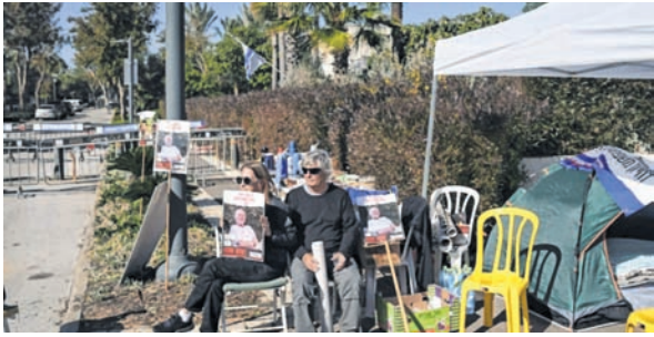
Relatives and friends of hostages sit on a camp outside the residence of Israeli Prime Minister Benjamin Netanyahu

The protest outside the prime minister's home and the remark by former Israeli army chief Gadi Eisenkot were among sever-