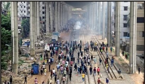
Students clash with police during a protest over the quota system for government job applicants, in Dhaka

Biden has spent the last several months accruing nearly 4,000 Democratic delegates by winning primary elections in US states and territories. Those delegates would normally vote for him to be the party's official presidential nominee at the Democratic National Convention that is set to take place August 19-22, but the rules do not bind or force them to do so. Delegates can vote with their conscience, which means they could throw their vote to someone else. By stepping aside, Biden is effectively "releasing" his delegates, potentially sparking a competition among other Democratic candidates to become the nominee.